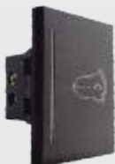
PTI150-MP Botón timbre de 3 módulos anodizado