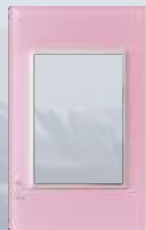
PP030-KP Placa metálica de 3 módulos colors rosa