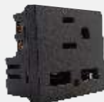
PUSB400-MA 2 Tomas de usb y contacto anodizado