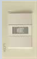
BP15-KH Placa con zumbador de 1 módulo colors hueso