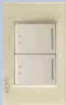
BP09-KH Placa con 2 interruptores de escalera de 1.5 módulos colors hueso