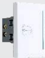
PTI150-MB Botón timbre de 3 módulos blanco