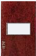
PP010-KMN Placa metálica de 1 módulo colors madera nogal