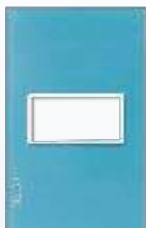
PP010-KC Placa metálica de 1 módulo colors cielo