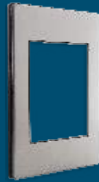
PP030 Placa metálica de 3 módulos