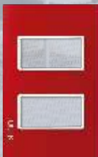
PP020-KR Placa metálica de 2 módulos colors rojo