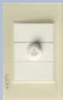
BP04-KH Placa con dimmer colors hueso