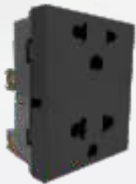
PC301E-MA Contacto duplex con conexión euroamericana de 3 módulos anodizado