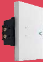
BA5152-B Interruptor de escalera de 3 módulos blanco