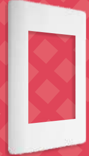
BA1203-B Placa de 3 módulos blanca