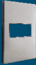
PP010 Placa metálica de 1 módulo