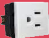
BA3101-B Contacto de 1.5 módulos blanco