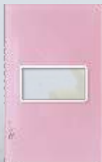
PP010-KP Placa metálica de 1 módulo colors rosa