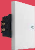
BA5151-B Interruptor sencillo de 3 módulos blanco