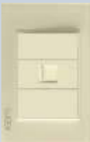
BP12-KH Placa con conexión a módem/internet colors hueso