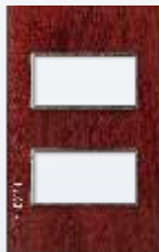
PP020-KMN Placa metálica de 2 módulos colors rojo madera nogal