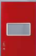
PP010-KR Placa metálica de 1 módulo colors rojo