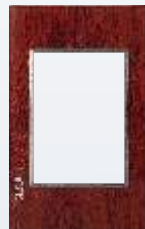
PP030-KMN Placa metálica de 3 módulos colors rojo madera nogal