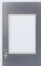
PP030-KG Placa metálica de 3 módulos colors gris