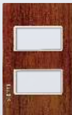
PP020-KMC Placa metálica de 2 módulos colors rojo madera cerezo