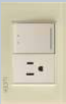
BP07/3-KH Placa con 1 interruptor de escalera y 1 contacto de 1.5 módulos colors hueso