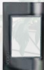
PP030-CEN Placa metálica de 3 módulos cristal espejo negro