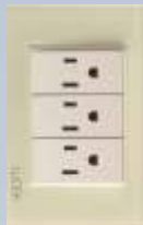
BP08-KH Placa con 3 contactos de 1 módulo colors hueso