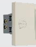
PTI150-MR Botón timbre de 3 módulos marfil