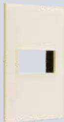
PP010-KH Placa metálica de 1 módulo colors hueso mate