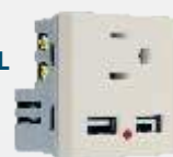
PUSB400-MR 2 Tomas de usb y contacto marfil