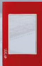
PP030-KR Placa metálica de 3 módulos colors rojo