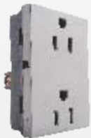
PC301-MP Contacto 2p+t (duplex suelto) plateado