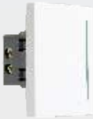
PA301-BL Interrupor sencillo de 3 módulos blanco