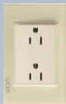
BP06-KH Placa con contacto duplex colors hueso