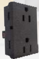
PC301-MA 2 Contactos 2p+t (duplex suelto) anodizado