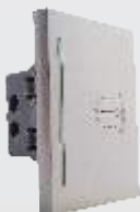
PTI150-MP Botón timbre de 3 módulos plateado