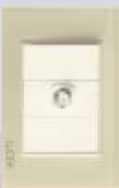
BP18-KH Placa con toma de televisión colors hueso