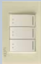
BP10-KH Placa con 3 interruptores de escalera de 1 módulo colors hueso