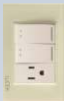
BP13-KH Placa con 2 interruptores de escalera y 1 contacto de 1 módulo colors hueso