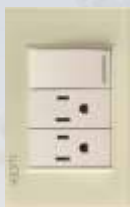
BP20-KN Placa con 1 interruptor sencillo y 2 contactos de 1 módulo colors hueso