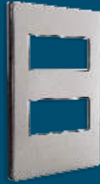
PP020 Placa metálica de 2 módulos