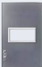
PP010-KG Placa metálica de 1 módulo colors gris