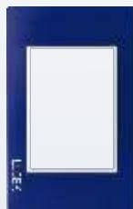
PP030-KA Placa metálica de 3 módulos colors azul