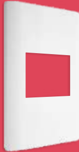
BA1201.5-B Placa de 1.5 módulos blanca