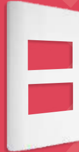
BA1202-B Placa de 2 módulos blanca