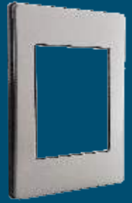
PP040 Placa metálica de 4 módulos