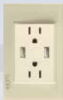
BP25-KN Placa con contacto duplex y 2 entradas usb colors hueso