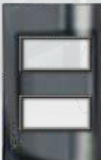
PP020-CEN Placa metálica de 2 módulos cristal espejo negro