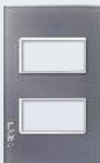
PP020-KG Placa metálica de 2 módulos colors gris