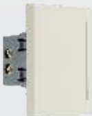
PA301-MR Interrupor sencillo de 3 módulos marfil