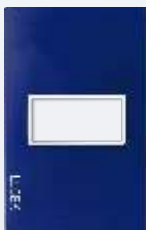
PP010-KA Placa metálica de 1 módulo colors azul