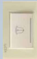
BP11-KH Placa con botón timbre de 3 módulos colors hueso