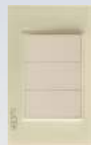
BP1200-KN Placa ciega colors hueso