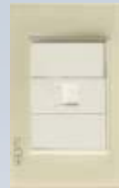
BP17-KH Placa con toma de teléfono colors hueso