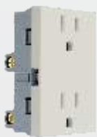
PC301-MR 2 Contactos 2p+t (duplex suelto) marfil