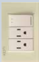
BP14-KH Placa con 1 interruptor de escalera y 2 contactos de 1 módulo colors hueso