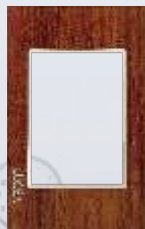
PP030-KMC Placa metálica de 3 módulos colors rojo madera cerezo