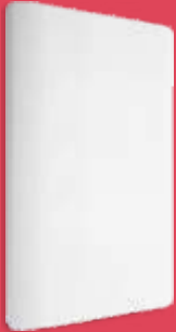
BA1200-B Placa ciega blanca