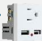
PUSB400-BL 2 Tomas de usb y contacto blanco