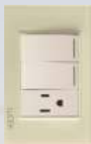
BP19-KN Placa con 2 interruptores sencillos y 1 contacto de 1 módulo colors hueso