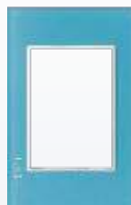
PP030-KC Placa metálica de 3 módulos colors cielo