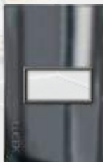
PP010-CEN Placa metálica de 1 módulo cristal espejo negro