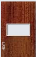
PP010-KMC Placa metálica de 1 módulo colors madera cerezo