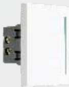
PA303-BL Interrupor de escalera de 3 módulos blanco