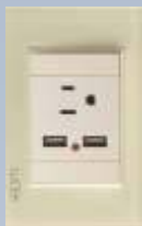
BP05-KH Placa con 1 contacto y 2 entradas de usb colors hueso