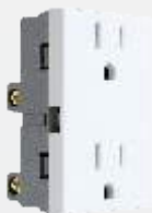
PC301-BL 2 Contactos 2p+t (duplex suelto) blanco