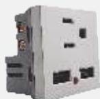
PUSB400-MP 2 Tomas de usb y contacto plateado