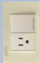
BP07-KH Placa con 1 interruptor sencillo y 1 contacto de 1.5 módulos colors hueso