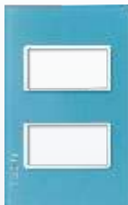
PP020-KC Placa metálica de 2 módulos colors cielo