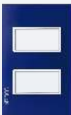
PP020-KA Placa metálica de 2 módulos colors azul