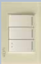
BP03/3-KH Placa con 3 interruptores de escalera de 1 módulo colors hueso