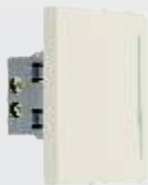
PA303-MR Interrupor de escalera de 3 módulos marfil